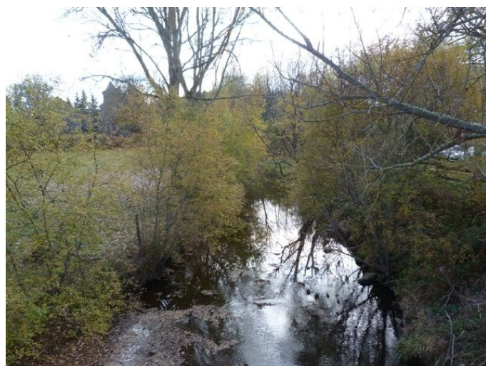
Dans l'Aubrac