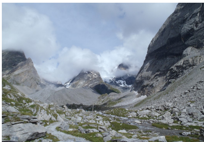
Col de la Vanoise