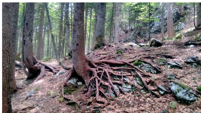
Forêt de Triglav

Plus de 200 participants venus de toutes les Alpes (dont certains représentants de clubs alpins) ont pu échanger, lors de conférences, ateliers et témoignages, sur les enjeux actuels du tourisme. Partout dans les Alpes, on rencontre des exemples de destinations attirant un nombre élevé de visiteurs mettant à mal l'environnement naturel et humain. Certaines montagnes ne sont pas épargnées par ce tourisme de masse (comme le Mont Blanc). Mais de nombreuses initiatives émergent à différentes échelles pour inventer une vie et un tourisme soutenable dans les territoires de montagne. Des exemples locaux ont notamment été présentés, comme celui du village de Jezersko, devenu le 26 mai le premier « village d'alpinistes » 1 de Slovénie, pour souligner sa volonté de proposer un tourisme alternatif respectant les espaces naturels.