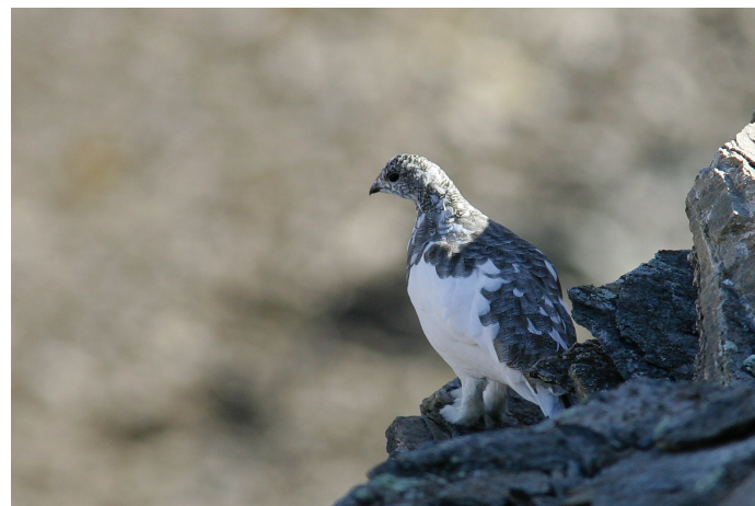
Lagopède alpin

présentent un impact évalué à : 12% pour la chasse à tir, 8% pour la photographie, 4% pour le parapente et 2% pour les sports motorisés.