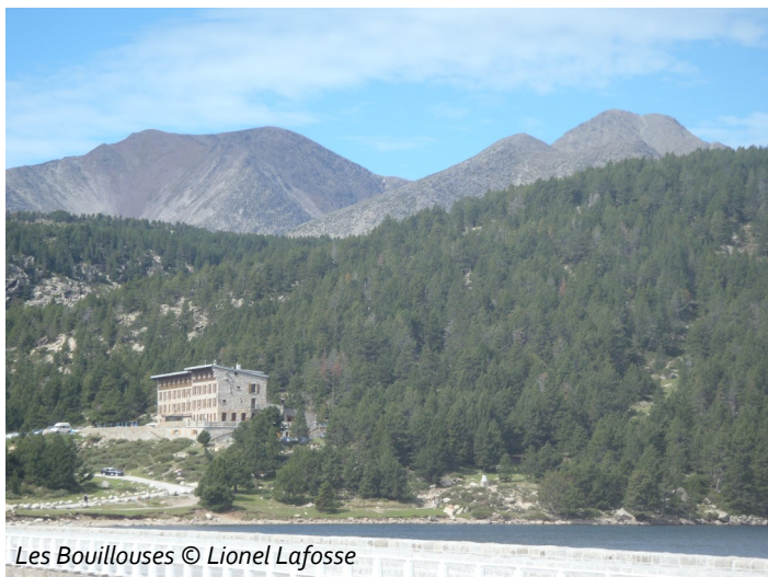
Les Bouillouses