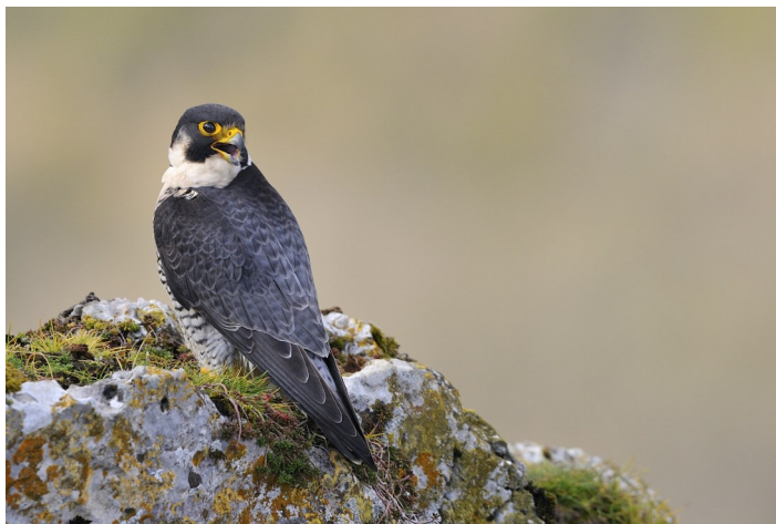
Faucon pelerin