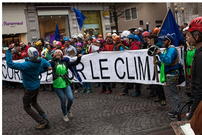
Encordés pour le climat