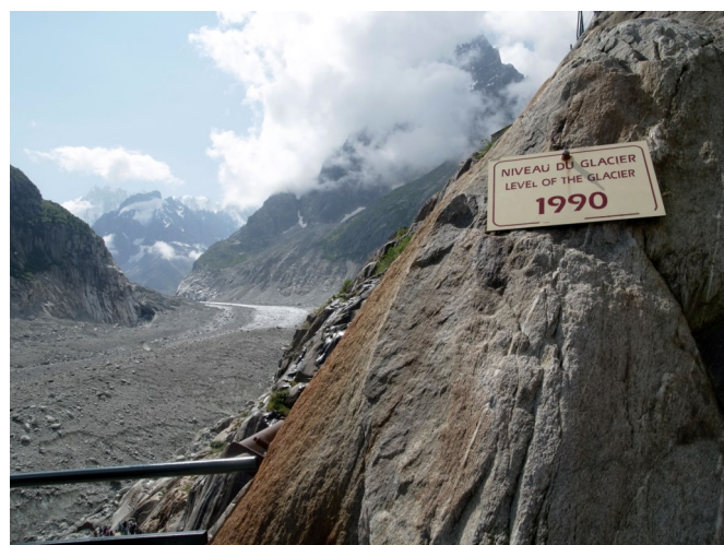
Mer de glace

Des échanges parfois un peu vifs ont eu lieu sur l'aménagement des refuges. Certains participants estiment que la modernisation des refuges a comme conséquence d'amener une fréquentation accrue et donc néfaste au milieu montagnard (les douches ont été particulièrement ciblées). D'autres pensent qu'il n'est plus possible d'accepter que certains refuges se chauffent encore au charbon (comme dans les Ecrins), en provenance probablement de régions hors d'Europe, et se le fassent livrer par hélicoptère : quel bilan carbone ! Certains proposent de favoriser l'accès en navette au chalet de La Bérarde.