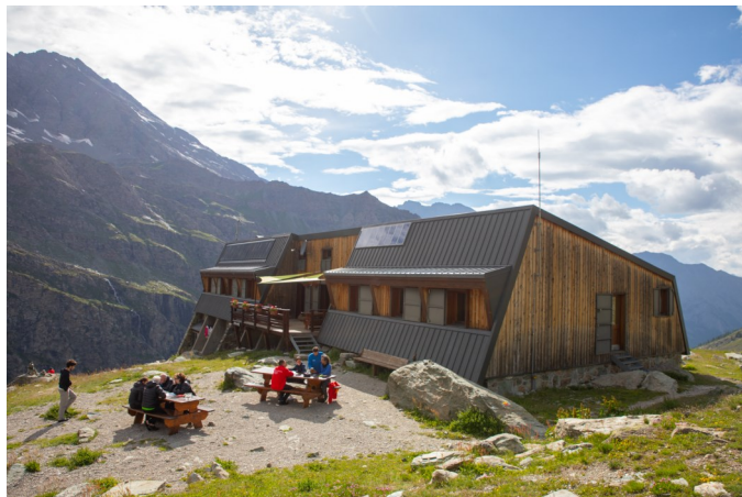
Refuge du Viso

Les panneaux photovoltaïques en place sur le toit ne permettent pas de couvrir l'ensemble des besoins énergétiques. Une pico centrale sera installée l'été prochain sur l'adduction d'eau potable. Des ampoules LED diminuent la consommation d'éclairage et une action de communication sensibilise les visiteurs à la transition énergétique dans ce site isolé. L'ensemble de ces mesures de sobriété et d'intégration d'énergie renouvelable permettront, à terme, de compenser l'utilisation du groupe électrogène.