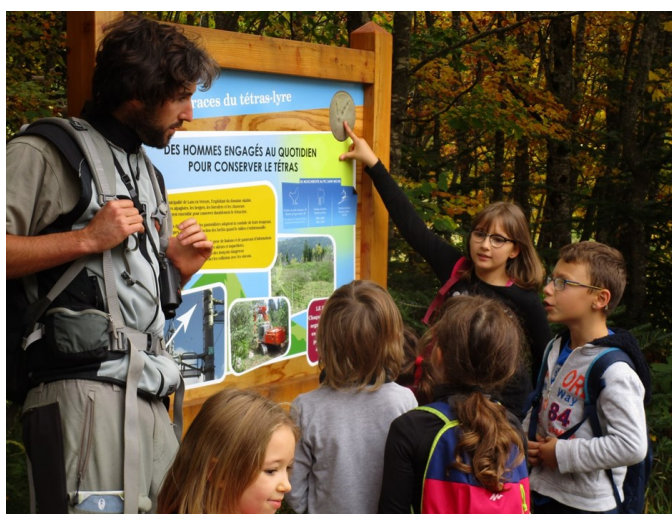
CAF Grenoble Oisans

Au terme de ces heures de débats passionnants, il est apparu que si le changement climatique est un constat partagé par tous et ne souffrant pas/plus de contestation sur le plan scientifique, les solutions envisageables pour notre obligatoire adaptation ne sont pas évidentes et ne laissent personne indifférent. Il y a même une grande urgence à essayer de trouver des solutions au-delà de la FFCAM.